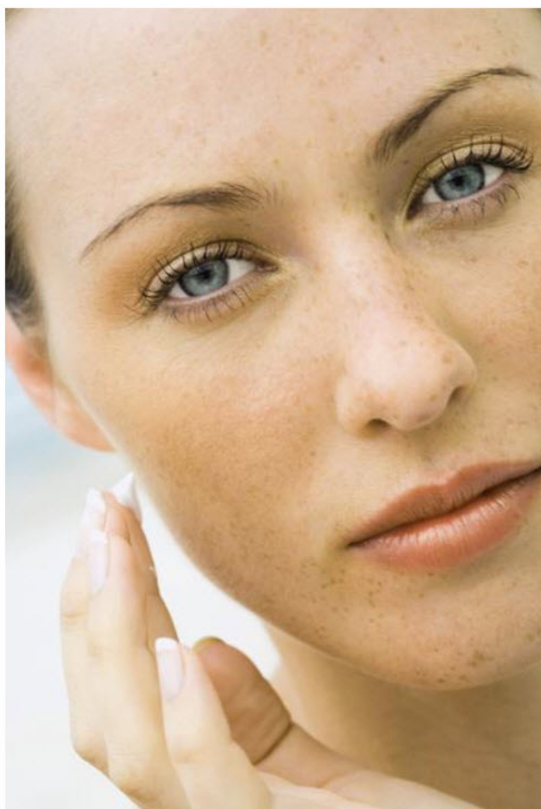
PINCHA SOBRE LA IMAGEN PARA VER EL ÁLBUM 'FOTOPROTECTORES: PREVENIR MEJOR QUE CURAR')

Es, ni más ni menos, que el cáncer de piel más habitual entre los jóvenes. Puede desarrollarse sobre un lunar previo o surgir de la nada. Suelen ser muy oscuros, tienden a cambiar de color y de forma con el paso del tiempo y, en ocasiones, pican. Según los dermatólogos, la forma de tratar un melanoma es hacerlo siempre a tiempo. Ellos insisten en la importancia de someterse a un mapeo de lunares (una técnica capaz de desenmascarar al melanoma en pocos minutos) una vez al año. ¿El tratamiento una vez instalado? La extirpación.